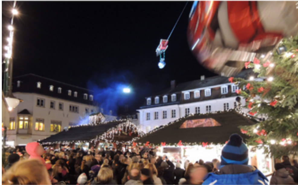
Weihnachtsmarkt in Saarbrücken

Tipp: Saarbrücken, Veranstaltungskalender, Feiern, Kultur, Stadtfeste, Filmfestival, Max Ophüls, Perspectives, Altstadtfest, Theater, Staatstheater, Theater Überzoo, Theaterschwefel